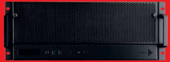
d3 Medienserver 4x4pro

Von all dem bekam das Publikum auf den Tribünen am Seeufer jedoch nichts mit. Sie feierten ihre Carmen mit begeistertem Applaus. Mit 100-prozentiger Auslastung der Sitzplätze zeigte die diesjährige Spielzeit wieder: Bregenz ist anders . Noch einmal wird es im kommenden Jahr so wirken, als mische eine riesenhafte Carmen ihre Karten und damit ihr Schicksal neu. Dann wird auch diese Bühne einer neuen weichen. Wir sind gespannt, wie dann Giuseppe Verdis „Rigoletto“ in Szene gesetzt wird. Und welche neuen Technik-Features die Vorstellung zu einem ganz besonderen Erlebnis machen.